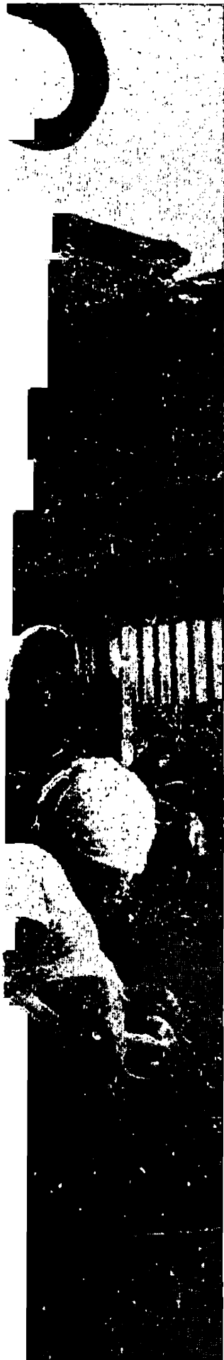
Plan d' « Octobre » coupé au montage

tant « Monsieur Verdoux » fut un échec. Non seulement chez eux, à l'Ouest, mais aussi chez nous. Et cela est tout à fait compréhensible : dans « Verdoux », Chaplin ne parvint pas à dépasser le cadre étroitement autobiographique, comme Pouchkine le faisait. Son film n'a pas de large résonance, de signification généralisée, il ne peut toucher les sentiments de millions d'hommes. Ce n'est pas une œuvre extravertie, elle est tournée vers le dedans, vers la profondeur. Elle ne parle que de ce qui concerne Chaplin lui-même ou bien ses amis les plus proches. Non, vraiment, le sujet est trop étroitement autobiographique.